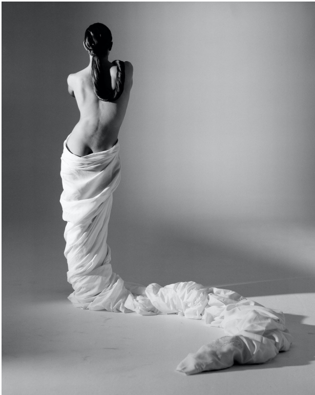
© Gian Paolo Barbieri – Catherine Noyes Interview Mag Milano, 1986 Courtesy of 29 ARTS IN PROGRESS gallery