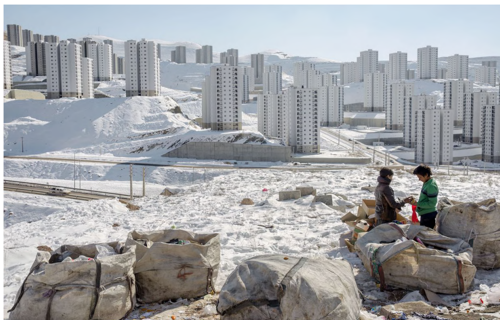
© Farnaz Damnabi - Waste picker, 2020 - Courtesy of 29 ARTS IN PROGRESS gallery

Denominata, con triste ironia, Pardis ( Paradiso ), era stata pensata con l'intenzione di invertire la migrazione delle città più densamente popolate; la costruzione massiva di nuove palazzine ha portato tuttavia alla devastazione dell'ecosistema montano e alla distruzione del suo habitat naturale, accrescendo ulteriormente le difficoltà dei collegamenti con la capitale. Le immagini esposte, parte dell'omonima serie Pardis , sembrano sospese tra realtà e sogno e mostrano il desolante panorama di un 'paesaggio lunare' – come definito dall'Artista stessa – di un Paradiso negato e che è di fatto un quartiere dormitorio dove sopravvivono, ghettizzati e privati dei più basilari servizi, moltissimi lavoratori e gran parte delle famiglie più povere.