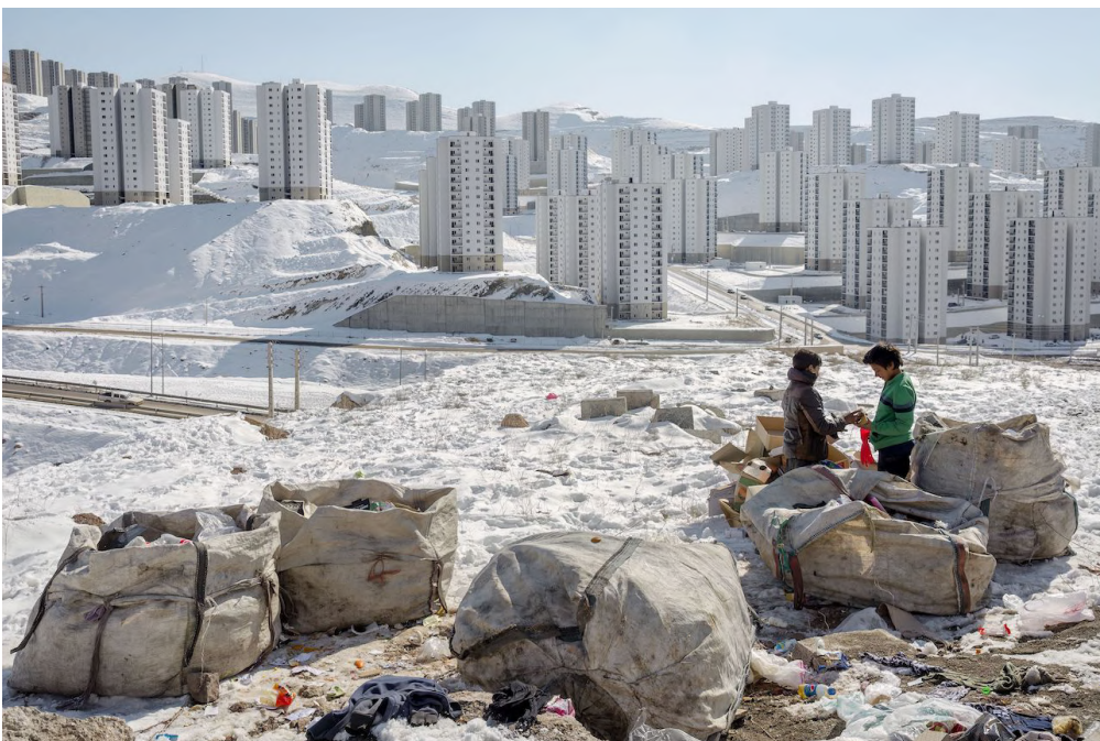
© Farnaz Damnabi - Waste picker, 2020 (Series: Pardis) - Courtesy of 29 ARTS IN PROGRESS gallery

Sadly ironically called Pardis ( Paradise ), it was intended to reverse the migration of the most densely populated cities; the mass construction of new buildings has, however, led to the devastation of the mountain ecosystem and the destruction of its natural habitat, making connections to the capital even worse. The pictures on display, that are part of the namesake Pardis series, appear somewhat suspended between reality and dream and show the bleak outlook of a 'lunar landscape' – as defined by the Artist herself – of a Paradise denied and which is in fact a dormitory district where a great many workers and most of the poorest families simply survive, in ghettos deprived of the most basic amenities.