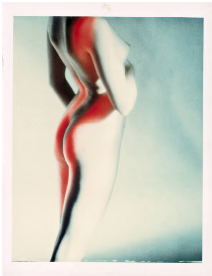
© Toni Meneguzzo - Nude of J., 1997

20 SEPTEMBER – 19 NOVEMBER 2022 29 ARTS IN PROGRESS, VIA SAN VITTORE 13, 20123 MILAN