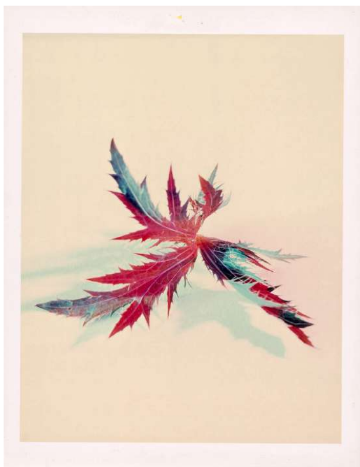
© Toni Meneguzzo - Float, 1997