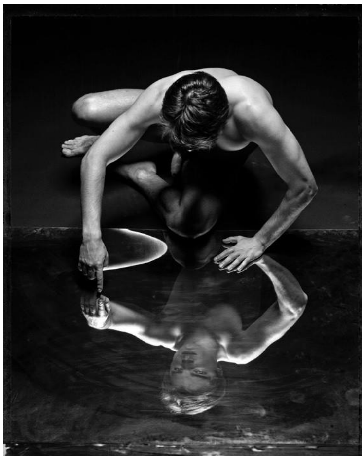
NARCISSUS, 2015 - Analog photography on Hahnemühle Fine Art Baryta 325 gr paper

10 - 21 Novembre 2015 Spazio Montebellotrenta Via Montebello 30, Milano