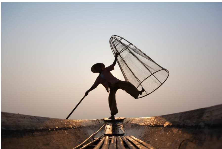
Francesco Soave, "The Fisherman", 2018

Dopo esperienze in architettura in Messico, nel mondo della moda in Italia, decide di partire per il sud-est asiatico per perseguire il suo sogno di fotografo: il suo sguardo da architetto lascia spazio a ciò che si ritrova di fronte alla macchina fotografica, mettendo al centro la figura umana.