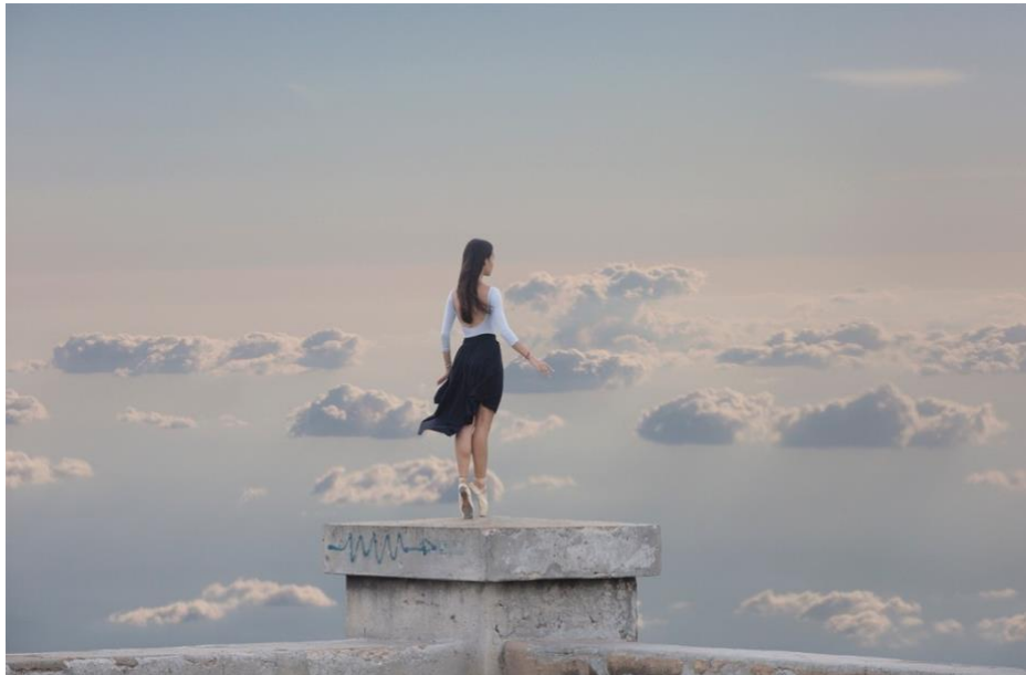
Gabriel Guerra Bianchini, "The glass island", 2018

Bianchini's work has been featured in Conde Nast Traveler, Artribune, Vistar, OnCuba, Nuevo Herald.