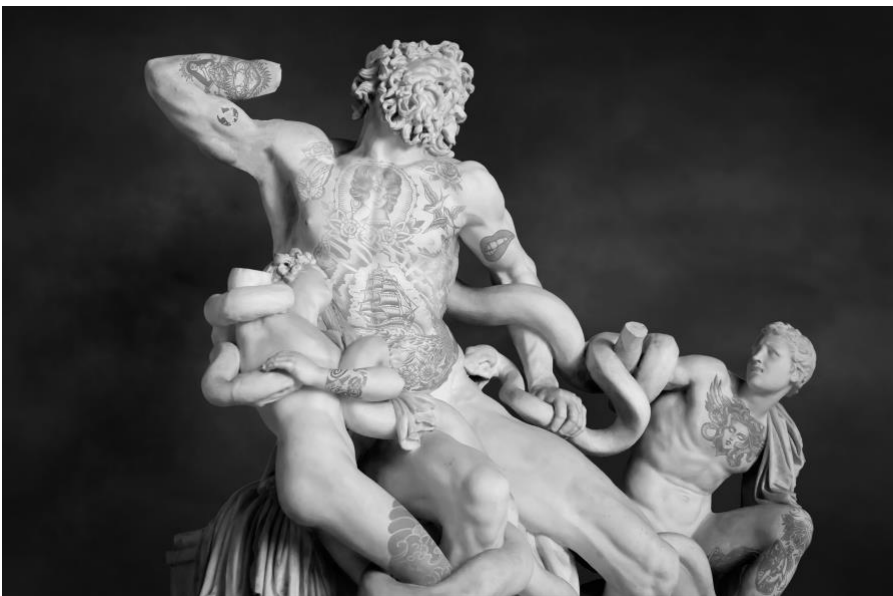
Gabriele Milani, "Gruppo del Laocönte, Agesandro, Atenodoro di Rodi e Polidoro, 1-2 sec ac", 2018

Le forme che lo circondano sono plasmate dal proprio vissuto e invitano lo spettatore a prenderne parte.