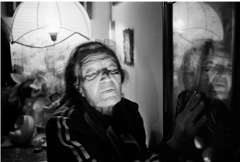
Ciro Battiloro, "Sanità#9", 2015

(Torre del Greco, 1984) è un fotografo italiano con base a Napoli. Ha studiato filosofia presso l'Università "Federico II" di Napoli. Per lungo tempo ha fotografato fuori dall'Italia, viaggiando in Africa (soprattutto Senegal e Marocco), Iran, Macedonia, Turchia, Romania. Il suo lavoro è un'analisi complessiva dell'essere umano e di come le relazioni, vissute in contesti di disagio sociale e abbandono, possano rivelare la loro vera natura e dar vita a una bellezza inaspettata. Usa un approccio molto intimo e attraverso la vita di tutti i giorni riflette su questioni sociali più generali. In particolare, la sua ricerca negli ultimi anni si concentra su alcuni quartieri del sud Italia (Rione Sanità a Napoli, Quartiere Santa Lucia, Cosenza) che a causa di processi storici e politiche edilizie, hanno subito una forte ghettizzazione.