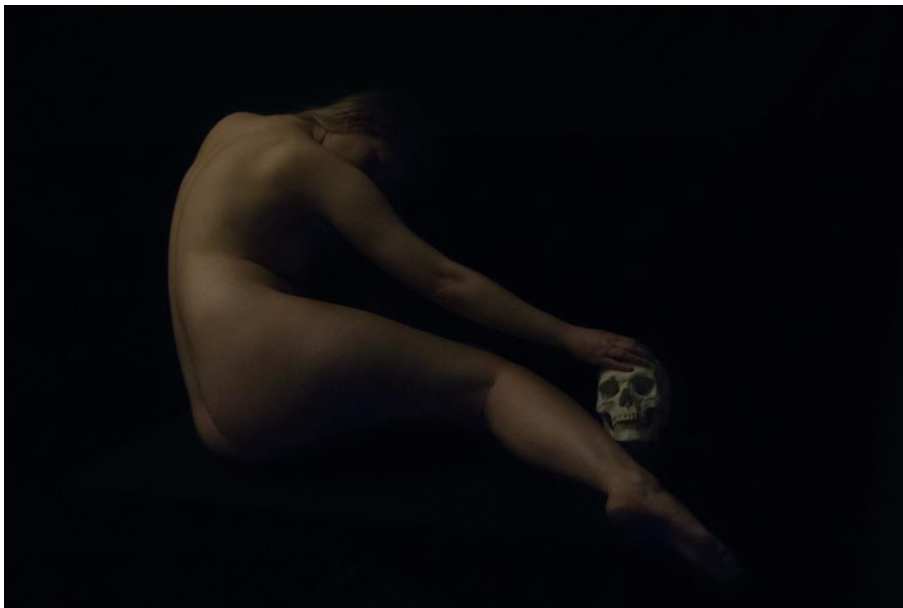
© Ronald Martinez - Nu Divin N6, 2013 - Courtesy of 29 29 ARTS IN PROGRESS gallery

From April 5 to May 27, 2017, 29 ARTS IN PROGRESS gallery hosts the solo show by French photographer Ronald Martinez (Annecy, 1978).