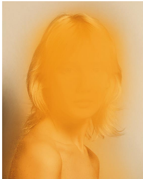
© Giuseppe Mastromatteo - Eclipse, 2020

From September 23, 2020 to February 27, 2021, 29 ARTS IN PROGRESS gallery in Milan (Via San Vittore 13) will present the group exhibition “On Seduction”: curated by Giovanni Peloso, the show investigates the theme of seduction through a selection of works by the artists Giuseppe Mastromatteo, Toni Meneguzzo and Rankin.