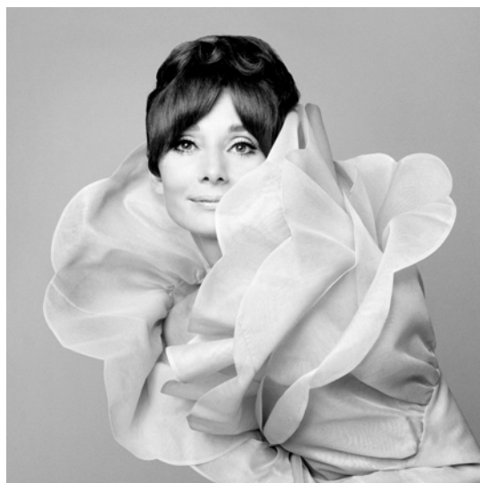
Audrey Hepburn, Vogue Italia, Roma, 1969