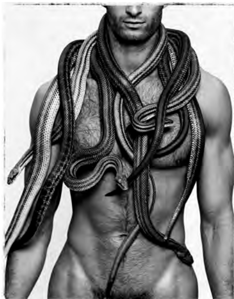
Lo Sciamano, 2015

Il tocco di Barbieri è quello che l'antichità ellenica ha per anni fatto legge: la bellezza. Così diventa testimone importante la foto del Narciso, anche Barbieri si guarda nello specchio d'acqua, preferendo suicidarsi dentro la sua stessa amata bellezza che tradire i suoi ideali.