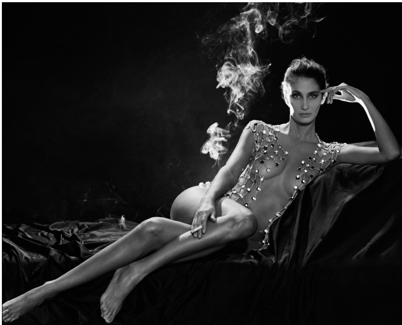
LA BELLA OTERO, 2014 - Fotografia in analogico su Hahnemühle Fine Art Baryta 308 gr paper, cm 70x90, edizione n° 1/15

Un affresco variopinto del mondo della moda e la sua dimensione sospesa tra realtà e immaginario.