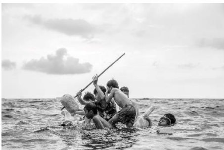
Francesco Soave, Escape from Trash Island #1 , 2019.