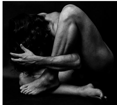
Matteo Piacenti, Senza Titolo #3 , 2020.