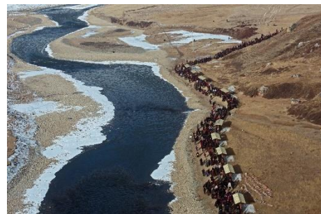
Jian Luo, Pilgrimage , 2019