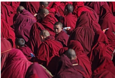
Jian Luo, The Maiden Nun , 2018.