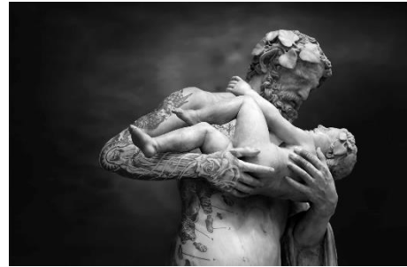
Gabriele Milani, Sileno con Dioniso bambino, copia Romana II sec. a.C. , 2018.

© Gabriele Milani, Courtesy MUSEC / 29 ARTS IN PROGRESS Gallery