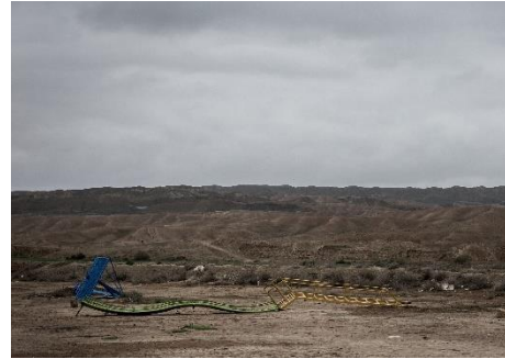
Farnaz Damnabi, Playing is my right, n. 5 , 2018. © Farnaz Damnabi, Courtesy MUSEC / 29 ARTS IN PROGRESS Gallery