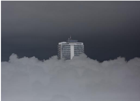
Gabriel Guerra Bianchini, The Capitol , 2016.