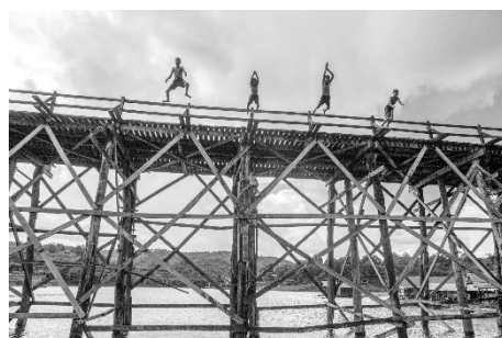
Francesco Soave, Flying Kids , 2017.