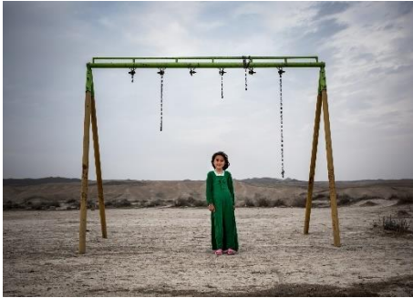
Farnaz Damnabi, Playing is my right, n. 2 , 2018.