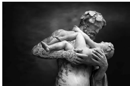
Gabriele Milani, Sileno con Dioniso bambino, copia Romana II sec. a.C. , 2018.

© Gabriele Milani, Courtesy MUSEC / 29 ARTS IN PROGRESS Gallery