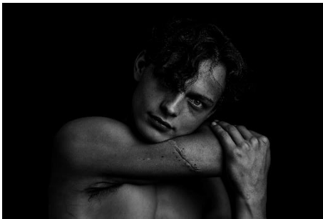
Matteo Piacenti, Senza Titolo #1 , 2018.